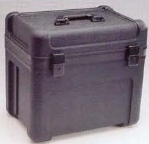
Mallette de transport KODAK EKTAPRO (en option)