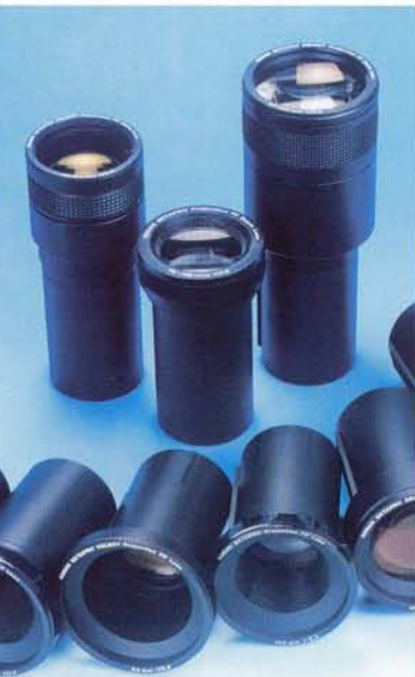
Objectifs de projection KODAK FF (en option)