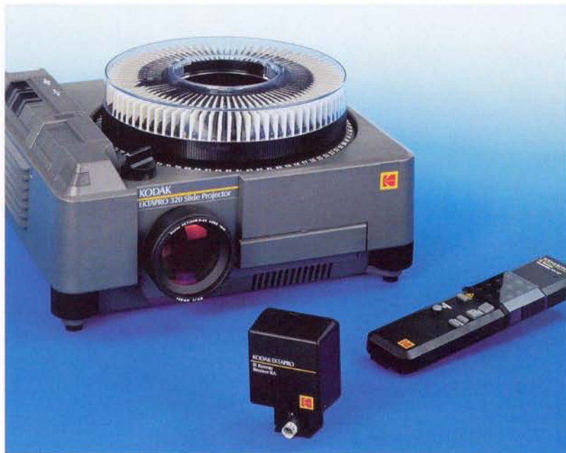
Projecteur KODAK EKTAPRO 320 avec la télécommande Infra - rouge (IR) KODAK EKTAPRO (en option)